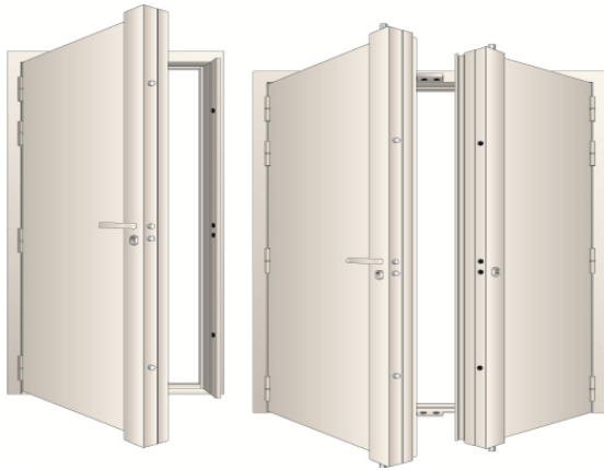
Serrure en Applique